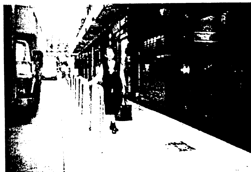
九龍樂道8號2樓 (蕭紅與端木蕻良居港時的住所)