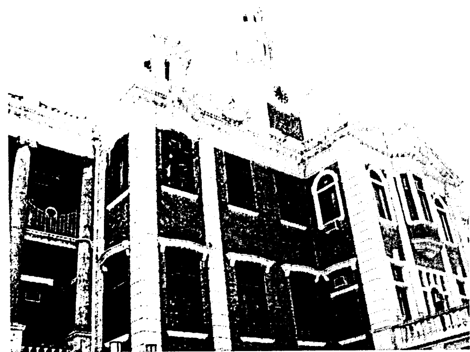
香港大學本部大樓