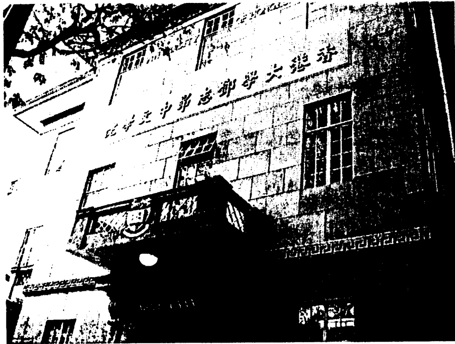
前香港大學中文系(現香港大學亞洲研究中心)